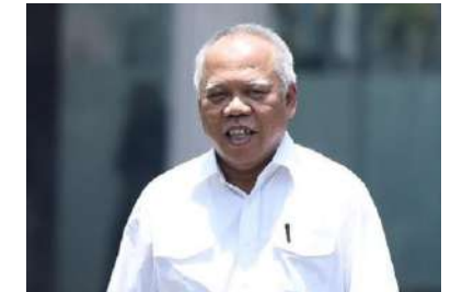
Basuki Hadimuljono Menteri Pekerjaan Umum dan Perumahan Rakyat