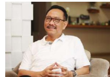
Bambang Susantono Kepala Badan Otorita Ibu Kota Nusantara (IKN)