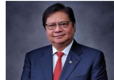
Airlangga Hartarto Menteri Koordinator Bidang Perekonomian