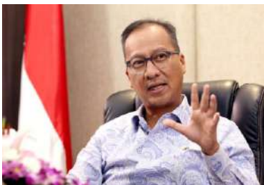
Agus Gumiwang Kartasasmita Menteri Perindustrian