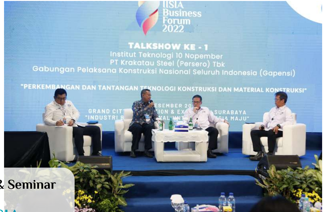
Talk Show & Seminar