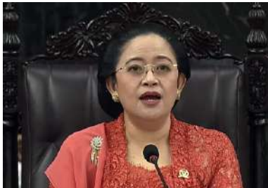
Puan Maharani Ketua DPR RI