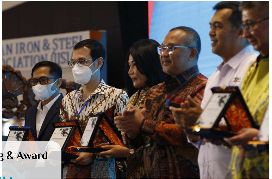
MoU Signing & Award