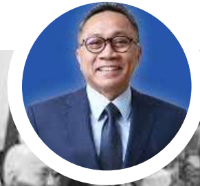
ZULKIFLI HASAN Menteri Perdagangan