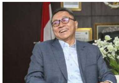
Zulkifli Hasan Menteri Perdagangan