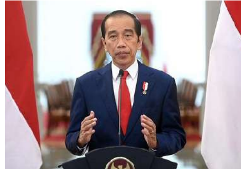
Joko Widodo Presiden Republik Indonesia