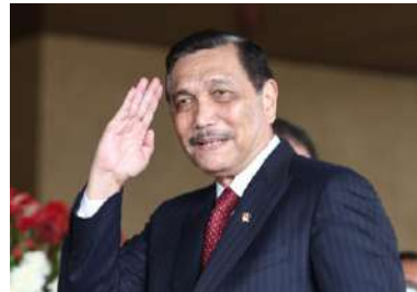
Luhut Binsar Pandjaitan Menteri Koordinator Bidang Maritim dan Investasi